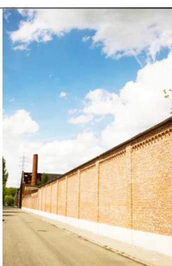
Hier komt een topsportcomplex

Nu de Vlaamse Regering via SOLvA subsidies heeft toegekend, komt eindelijk "schot" in de zaak. De asbestsaneringswerken zijn uitgevoerd. De bodemsanering wordt verder gezet. De afbraakwerken zullen starten na het bouwverlof in juli 2013. De bodemsanering en de afbraak zullen tegen eind van dit jaar klaar zijn. Vier bouwwerken zullen niet worden gesloopt: de reeds gerenoveerde fabrieksmuur (uiteraard), de vroegere conciërgewoning, het kantoorgebouw en de twee bakstenen schoorstenen. Deze bouwwerken zullen een mooie tegenstelling vormen met de hedendaagse materialen en de vormgeving van het multifunctionele sportcomplex dat er zal verrijzen. Dit sportcomplex wordt het grootste in de regio met ruimte voor topsportevenementen. Er zal een sportzaal van 55 op 45 meter, een turnhal van 30 op 45 meter, een zaal voor gevechtssporten, een vergaderzaal, horecaruimte, sauna en fitness zijn. In een aparte ruimte kunnen scholen en sportverenigingen zelfs sportmateriaal ontlenen. Wie individueel sport, zoals joggers of fietsers, zal er zich kunnen omkleden en douchen. Bedoeling is het sportcomplex te openen eind oktober 2014.