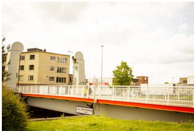
Grondig gerenoveerde Zwartehoekbrug

Indien de stadsbegroting en de geplande verkeerswerken in de omgeving het toelaten, zal de Denderbrug volledig gerenoveerd worden in 2014. Deze renovatie zal dezelfde zijn als deze die in 2012 gebeurde aan de Zwartehoekbrug in Aalst-centrum. Dus: volledig herverven en nieuwe rijwegbekleding. Voor zover praktisch mogelijk, zal de brug ook wat hoger worden gelegd zodat deze bij hoge waterstand niet meer zo snel moet worden opgetrokken. De brug zal dus meerdere maanden worden gesloten voor het verkeer. CD&V-Erembodegem dringt er dan ook op aan dat een tijdelijke brug voor voetgangers en fietsers wordt aangelegd zodat de bewoners toch nog zonder omweg langs Aalst of Denderleeuw de andere oever kunnen bereiken.