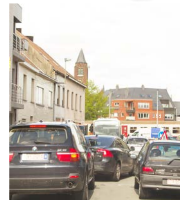
Gevaarlijk druk verkeer