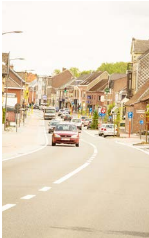
Zo wordt het (vb Brusselse Steenweg Hekelgem)

CD&V-Erembodegem vraagt de stad om de bewoners van de Brusselbaan tijdig te informeren over de werken en aan te dringen op een goede signalisatie.