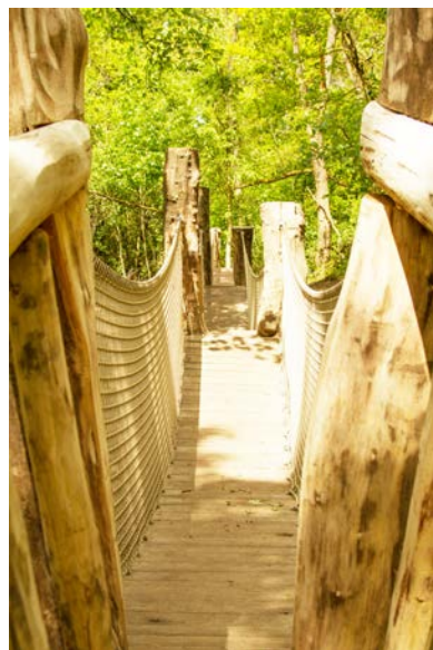
Gerstjens – heringericht

De ecologische inrichting van waterlopen en waterpartijen, het verbeteren van de waterkwaliteit, het uitbreiden van de kwelvegetatie, de inrichting van de verblijfplaats voor vleermuizen...vormden ook belangrijke doelen in het project. Zo werd voldaan aan een jarenlange vraag door CD&V