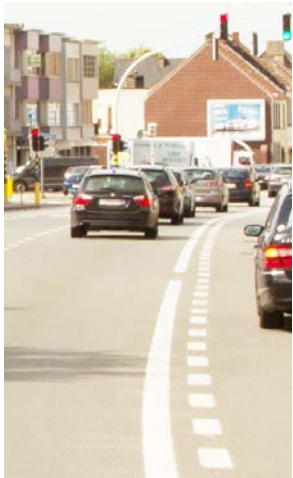
Zo is het nu

In opdracht van het Vlaamse Gewest zal de Brusselsesteenweg / Brusselbaan van het kruispunt Albrechtlaan tot de grens met Hekelgem worden heraangelegd. De heraanleg zal in een tiental fasen verlopen. In elke fase zal voor een bepaald stuk van deze gewestweg niet alleen de wegenis en de riolering worden vernieuwd, maar zullen de nutsbedrijven ook kabels en leidingen leggen. Vermoedelijk wordt gestart in juli van dit jaar aan het kruispunt Albrechtlaan. De meest storende werken voor het verkeer zullen in het weekend worden uitgevoerd. Tijdens bijna de volledige duur van de werken zal verkeer in beide richtingen mogelijk zijn. Hoewel de stad duidelijk betrokken partij is, heeft ze hierbij niet het eerste of laatste woord.